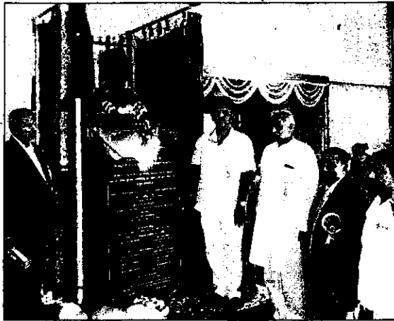
ಶರಾವತಿ ವಿದ್ಯುದಾಗಾರದ ನವೀಕೃತ ನಿಯಂತ್ರಣ ಕೇಂದ್ರವನ್ನು ಸಚಿವ ಡಿ.ಕೆ. ಶಿವಕುಮಾರ್ ಉದ್ಘಾಟಿಸಿ, ಮಾಜಿ ಪ್ರಧಾನಿ ಲಾಲ್ ಬಹದ್ದೂರ್ ಶಾಸ್ತ್ರಿ ಪ್ರಶ್ನೆ ಅನಾವರಣಗೊಳಿಸಿದರು. ಸಚಿವ ಕಾಗೋಡು ತಿಮ್ಮಪ್ಪ ಮತ್ತಿತರರು ಹಾಜರಿದ್ದರು.

ಸ್ವಾಭಾವಿಕವಾಗಿ ದಟ್ಟ ಹೆಚ್ಚು: ವಿದ್ಯುತ್ ಉತ್ಪಾದನೆಯಲ್ಲಿ ಸಂಪೂರ್ಣ ಸ್ವಾಭಾವಿಕವಾಗಿ ಸಾಧಿಸುವಂತೆ ದೃಢ ಹೆಜ್ಜೆ ಇರಿಸಿರುವ ರಾಜ್ಯವು, ಈ ವರ್ಷದ ಡಿಸೆಂಬರ್