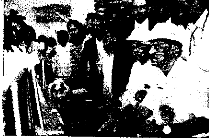
ಜೋಗದಲ್ಲಿ ನವೀಕೃತ ಶರಾವತಿ ವಿದ್ಯುದಾಗಾರವನ್ನು ಸಚಿವ ಡಿ.ಕೆ.ಶಿವಕುಮಾರ್ ಲೋಕಾರ್ಪಣೆ ಮಾಡಿದರು.