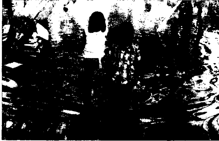
ಉಕ್ಕಿ ಹರಿದ ವ್ಯವಹಾರವಿತಿ

ರಾತ್ರಿ ಬಿದ್ದ ಛಾಂಟಿ ಮಳೆಯಿಂದಾಗಿ ವ್ಯವಹಾರವಿತಿ ಮತ್ತಿತರ ಕೆರೆಮೇಳು ತುಂಬಿ ಹರಿಯುತ್ತಿರುವ ಪರಿಣಾಮ ನಗರದ ಬಹುತೇಕ ರಸ್ತೆಗಳು ಕೆರೆಗಳಂತಾಗಿದ್ದು, ವಾಹನ ಸಂಚಾರಕ್ಕೆ ತೀವ್ರ ಅಡಚಣೆ ಎದುರಾಯಿತು. ದೊಡ್ಡದಿಂದ ಕೆಲವು ವಾರ್ಡ್‌ನಲ್ಲಿ ಮೋರಿ, ಚಂದಿಗಲು ತುಂಬಿ ಹರಿದ ಹಿನ್ನೆಲೆಯಲ್ಲಿ ಇಡೀ ಗ್ರಾಮವೇ ಜಲಾವೃತಗೊಂಡಿತ್ತು. ಸ್ಥಳೀಯರು ರಾತ್ರಿಯಿಡೀ ಜಾಗರಣೆ ನಡೆಸಿ ಮನೆಗೆ ನುಗ್ಗಿದ ನೀರು ಹೊರಹಾಕುವ ಕಾರ್ಯದಲ್ಲಿ ತೊಡಗಿದ್ದರು. ಹಾಗೆಯೇ ಗ್ರಾಮಾಂತರ ಪ್ರದೇಶಗಳಾದ ನೆಲಮಂಗಲ, ಚಿಕ್ಕಬಳ್ಳಾಪುರ, ಮಾಗಡಿ, ದೇವನಹಳ್ಳಿಗಳಲ್ಲೂ ಧಾರಾಕಾರ ಮಳೆಗೆ ಕೆರೆ-ಓಂಟಿಗಳು ತುಂಬಿ ಹರಿಯುತ್ತಿವೆ.