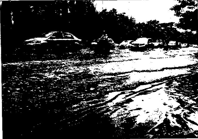
ನಗರದಲ್ಲಿ ಶುಕ್ರವಾರ ಮರದ ಮಳೆಗೆ ಮನೆ ಮಿನಿಫೋ ಇಲಾಖೆಗೆ ಎದುರಿಸಿ ದಿದ್ದು ರಸ್ತೆಯು ನೆರೆಯಂಪಾಯಿತು

ಹಳೇ ಮರ ಇದ್ದಾಗಿದ್ದು, ಮಳೆಯ ವೇಳೆ ಬೋಲಾಗಿ ಗಾಳಿ ಬೀಸಿದ್ದರಿಂದ ಉರುಳಿ ದಿದ್ದಿದೆ. ಮನೆಯ ಗೋಡೆಗಳು ಸೆಂಕ್ರುರು ಲಿದ್ದು, ಹಾನಿ ಉಂಟಾಗಿದೆ. ಅದ್ವೈವಹಾತ್ ಯಾವುದೇ ಪ್ರಾಣಾಪಾಯ ಸಂಭವಿಸಿಲ್ಲ ಎಂದು ಗುರುನಾಥ್ ಪ್ರಜಾವಾಣಿಗೆ ತಿಳಿಸಿದರು. 6 ಕಾರು ಜಖಂ: ಚಾಮರಾಜೇಶ್ವರಿ 3ನೇ ಅಡ್ಡರಸ್ತೆ ಬಳಿ 2, ಬಸವನಗುಡಿ ಅಂಜನೇಯ ದೇವಸ್ಥಾನ ಬಳಿ, ಆರ್. ವಿ.ರಸ್ತೆ ಹಾಗೂ ಆನಂದರಾವ್ ವೃತ್ತ ಮತ್ತು ಕೆ.ಎಸ್.ಉದ್ಯಾನದಲ್ಲಿ ತಲಾ ಒಂದು ಕಾರುಗಳ ಮೇಲೆ ಮರಗಳು ಉರುಳಿದಿದ್ದು, ಕಾರುಗಳು ಭಾಗಶಃ