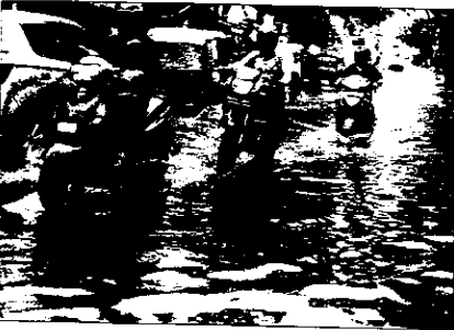
ನಗರದಲ್ಲಿ ಶುಕ್ರವಾರ ಹಗಲು- ಇದುವು ಸುರಿದ ಭಾರಿ ಮಳೆಗೆ ಜನಜೀವನ ಅಸ್ತವ್ಯಸ್ತಗೊಂಡ ದೃಶ್ಯಗಳು.