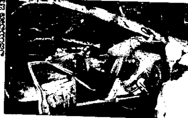
ಕಾರಿನ ಮೇಲೆ ಬಿದ್ದ ಮರವನ್ನು ತೆರವು ಮಾಡುತ್ತಿರುವ ಅಗ್ನಿಶಾಮಕ ಸಿಬ್ಬಂದಿ.

ಬೆಂಗಳೂರು: ಶುಕ್ರವಾರ ಸುರಿದ ಮತ್ತೊಂದು ಮಹಾಮಳೆಗೆ ರಾಜಧಾನಿ ಬೆಚ್ಚಿಬಿದ್ದಿದೆ. ಎರಡು ಗಂಟೆಗೂ ಹೆಚ್ಚು ಕಾಲ ಸುರಿದ ಮಳೆಯಿಂದಾಗಿ ಜೆಸಿ ರಸ್ತೆಯ ಡಿವೈಂನರಿ ರಸ್ತೆಯಲ್ಲಿ ಗ್ಯಾರೇಜ್ ಮುಂದೆ ನಿಲ್ಲಿಸಿದ್ದ ಕಾರಿನ ಮೇಲೆ ಭಾರೀ ಗಾತ್ರ ಮರಬಿದ್ದು ಸುಂಕದಕಟ್ಟೆಯ ದಂಪತಿ ಸೇರಿ ಮೂವರು ಸ್ಥಳದಲ್ಲೇ ಸಾವನ್ನಪ್ಪಿದರು. ಮೆಕ್ಯಾನಿಕ್ ಓರ್ವ ಗಂಭೀರವಾಗಿ ಗಾಯಗೊಂಡಿದ್ದಾನೆ. ವಿವರ ಪುಟ 5B