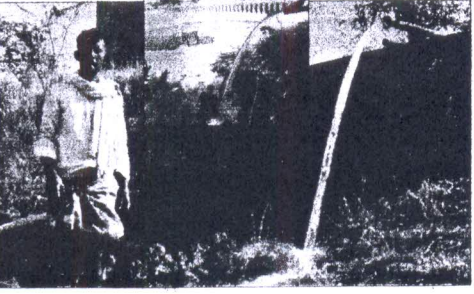
ಕಳಸೂರು ಗ್ರಾಮದ ರೈತರೊಬ್ಬರು ವರದಾ ನದಿಗೆ ಬೋರ್‌ವೆಲ್‌ನಿಂದ ನೀರು ಹರಿಸುತ್ತಿರುವುದು.