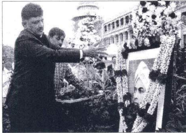
ವಿಧಾನಸೌಧದ ಆವರಣದಲ್ಲಿ ಮಾಜಿ ಮುಖ್ಯಮಂತ್ರಿ ಕೆಂಗಲ್ ಹನುಮಂತಯ್ಯ ಭಾವಚಿತ್ರಕ್ಕೆ ಇಂಧನ ಸಚಿವ ಡಿ.ಕೆ. ಶಿವಕುಮಾರ್ ಗುರುವಾರ ಪುಷ್ಪನಮನ ಸಲ್ಲಿಸಿದರು.

ಬೇಸಿಗೆಯಲ್ಲಿ ವಿದ್ಯುತ್ ಸಮಸ್ಯೆ ಭೀಕರವಾಗಿ ಕಾಡಬಹುದೆಂಬ ಆತಂಕ ಜನರಿಗೆ ಬೇಡ. ಸಮರ್ಪಕ ವಿದ್ಯುತ್ ಪೂರೈಕೆಗೆ ಕ್ರಮ