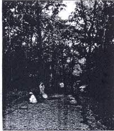
ಹೆಮ್ಮಡಗಾ ಗ್ರಾಮದಿಂದ ದೇಗಾಂವ ಗ್ರಾಮದವರೆಗೆ ಸೂರಕ್ಕೂ ಹೆಚ್ಚು ವಿದ್ಯುತ್ ಕಂಬಗಳನ್ನು ಅಳವಡಿಸಲಾಗಿದೆ (ಎಡಚಿತ್ರ) ಭೀಮಗಡ ವನ್ಯಧಾಮದ ಅಲನಾಳಿ ಕ್ರಾಸ್‌ನಿಂದ ಚಾಮುಗಾಂವ್ ಗ್ರಾಮಕ್ಕೆ ರಸ್ತೆ ನಿರ್ಮಾಣ ಮಾಡಲಾಗುತ್ತಿದೆ

ವನ್ಯಜೀವಿ ಸಂರಕ್ಷಣಾ ಕಾಯ್ದೆ-1972ರ ನಿಯಮಾವಳಿ ಉಲ್ಲಂಘಿಸಿದೆ. ಅಲ್ಲದೆ, ಅರಣ್ಯ ಸಂರಕ್ಷಣೆಗೆ ಸಂಬಂಧಿಸಿದಂತೆ ಈ ಹಿಂದೆ ಸುಪ್ರೀಂ ಕೋರ್ಟ್ ನೀಡಿದ್ದ ಆದೇಶಗಳನ್ನೂ ನಿರ್ಲಕ್ಷಿಸಲಾಗಿದೆ ಎಂದು ವನ್ಯಜೀವಿ ಪ್ರಿಯರು ಆಕ್ರೋಶ ವ್ಯಕ್ತಪಡಿಸಿದ್ದಾರೆ.